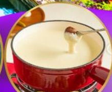
ฟองคูชีส