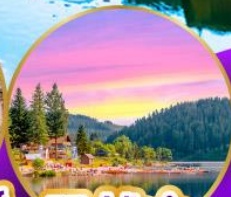
ททิเช่ ปาด้า