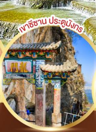
เขาชาน ประตุมังกร