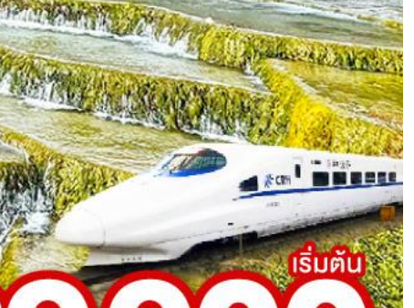
เริ่มต้น