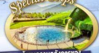
เข้าชมความอลังการของ พิพิธภัณฑ์ Swarovski แห่งเมืองวัตเทินส์