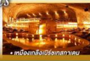
• เมืองเกอิลือบ์ริชเทสกาเดิน