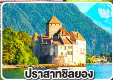
ปราสาทชิลยอง