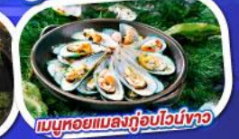
เมนูหอยแมลงภู่อบไวน์ขาว