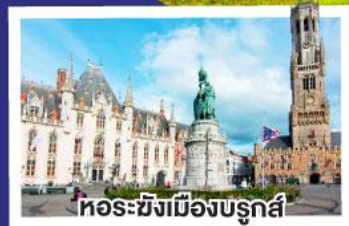
หอรบั้งเมืองบรูจส์