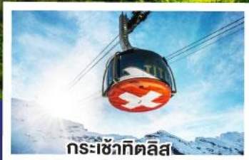
กระเช้าทิตลิส