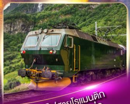
รถไฟสายโรเมนติก ฟลัมส์บาน่า