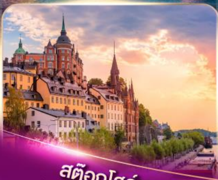
สต็อกโฮล์ม เวนิสแห่งยุโรปเหนือ