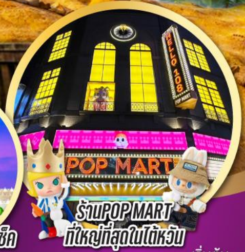
ร้านPOP MART ที่ใหญ่ที่สุดในไต้หวัน

เมนูพิเศษ!! ชาบู บุฟเฟ่ต์ ปลาประธาราธิบคิ, เสี่ยวหลงเปา