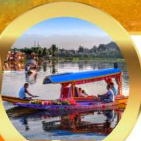
ล่องเรือชิคาร่า