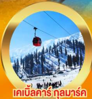
เคเบิลคาร์ กุลมาร์ค