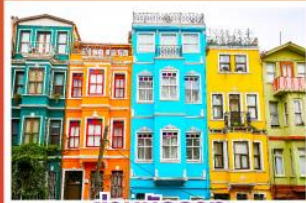
ย่านบิลลาท