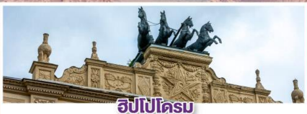
ฮิปโปโดรม