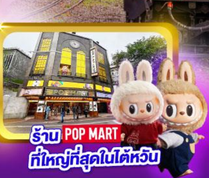
รับ POP MART ที่ใหญ่ที่สุดในไต้หวัน