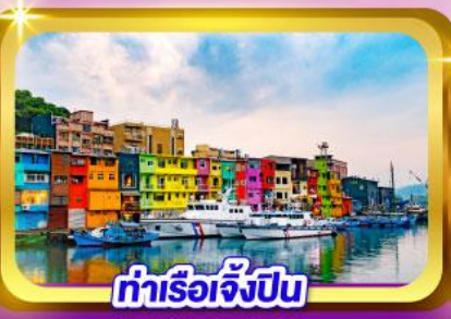
ท่าเรือเจิ้งปิง