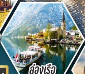
ล่องเรือ ทะเลสาบฮัลสติก