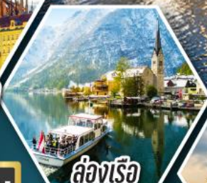
ล่องเรือ ทะเลสาบฮัลสติก