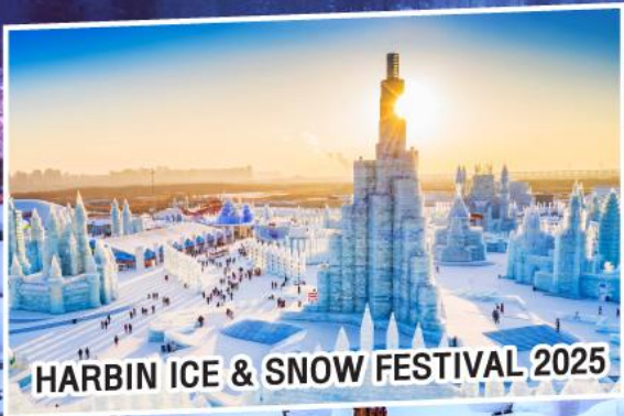
HARBIN ICE & SNOW FESTIVAL 2025