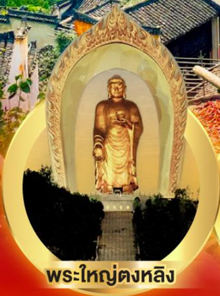
พระใหญ่ตงหลิง