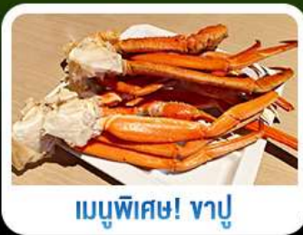
เมนูพิเศษ! ขาปู

เกาะเอโนะชิมะ วิวสวยงามติด 1 ใน 100 ภูมิทัศน์ญี่ปุ่น พร้อมชมปราสาทเจ้าศักดิ์สิทธิ์ เที่ยวเต็มทั้ง 3 วัน แบบจุใจ ทั้งวัด ศาลเจ้า สวนดอกไม้ และช้อปปิ้ง