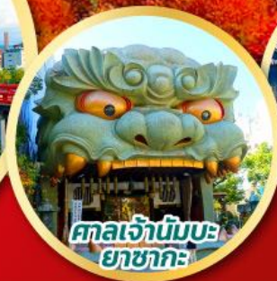
ศาลเจ้ามังกร ยาซากะ