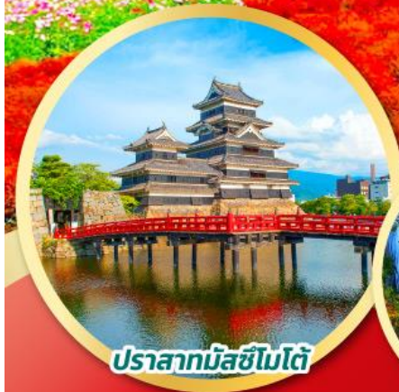
ปราสาทมัตสึชิมะโต