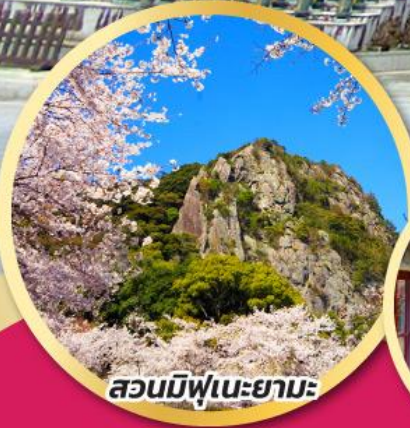
สวนมิฟูเนะยามะ