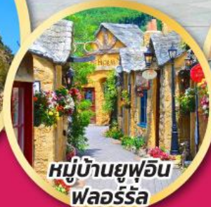
หมู่บ้านยูฟูอิน พลอร์ริล