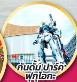
กัณฑ์มึ ปาร์ค ฟุกุโอกะ