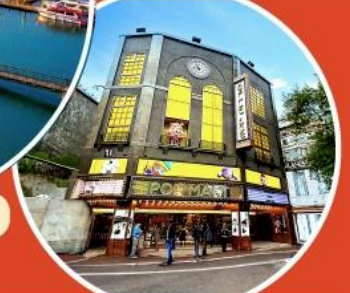
ร้าน POP MART ใหญ่ที่สุดไต้หวัน