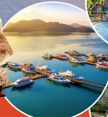
ทะเลสาบสุริยขึ้นจันทรา