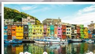
หมู่บ้านประมงเจลาเกี