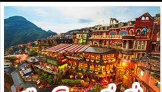
เมืองโบราณจีวเฟิน