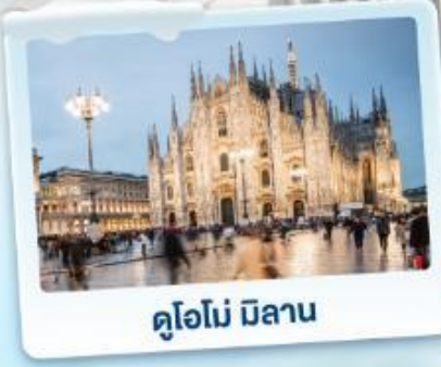
คูโอโม มิลาน