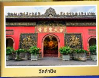
วัดต้าฉีอู