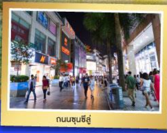
ถนนซุนซีอู