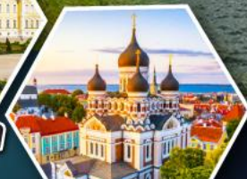
วิหารอเล็กซานเดอร์ นอฟกี (ทาลลินน์)

• ล่องเรือซิลเซียไลน์ข้าม จากเอสโทเนียสู่ฟินแลนด์ • เข้าชมโบสถ์หิน Rock Church