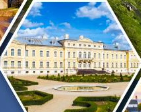
พระราชวังรินดาล