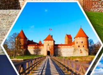
ปราสาทกราด