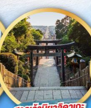
ศาลเจ้ามียาจิดากะ