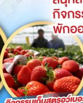
กิจกรรมเก็บสตอร์วเบอร์รี่