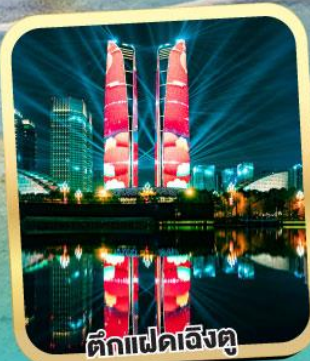
ตึกแฝดเิ่งตุ