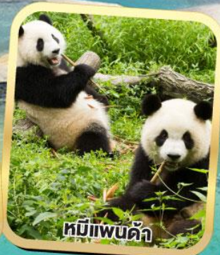
หมีแพนด้า