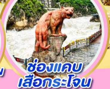
ช่องแคบ เสือกระโจน