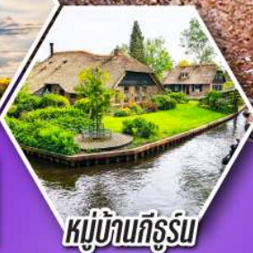
หมู่บ้านกังธูร์น