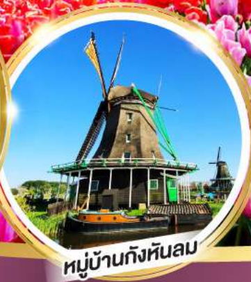
หมู่บ้านกังหันลม