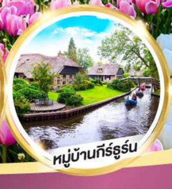
หมู่บ้านกิร์ธูร์น