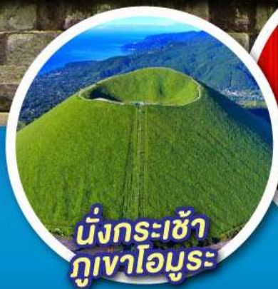
นั่งกระเช้า กุเอาโอมุระ

จุดชมวิวกุเอาไฟฟูจิ ป่าสนมิโฮะ โนะมัตสึบาระ