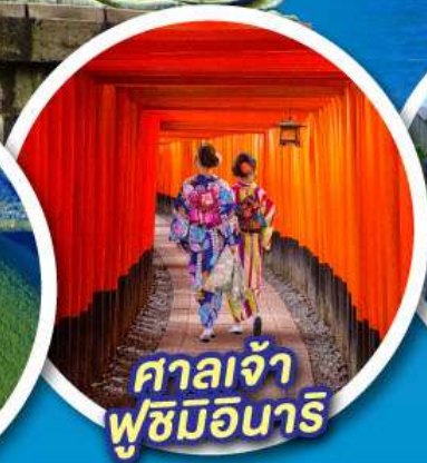
ศาลเจ้า ฟูชิมิอินาริ