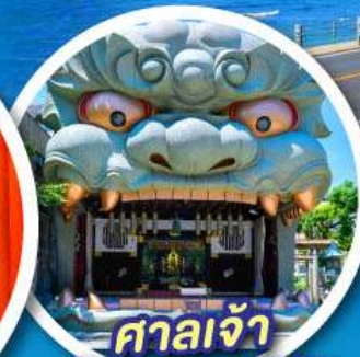
ศาลเจ้า นัมบะยาซากะ