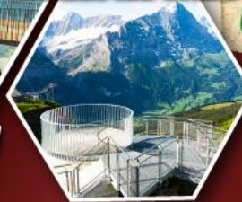
ยอดเขา ฮาร์เดอร์คูลม