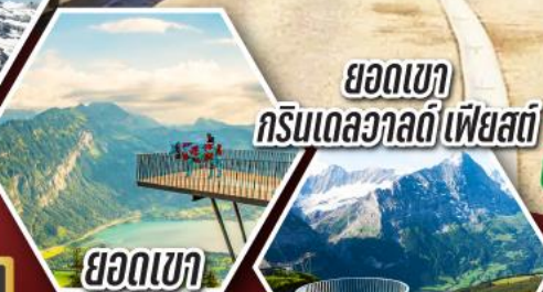
ยอดเขา กรินเดลวาลด์ เพียสตี