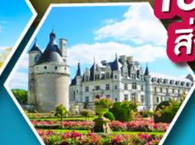
ปราสาทเชอนงโซ

เข้าชมมหาวิหารมรดกแห่งต์มิเชล สิ่งมหัศจรรย์ของประเทศฝรั่งเศส