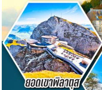
ยอดเขาพิลาตุส