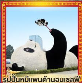
รูปปั้นหมีแพนด้าอนเซลฟี่