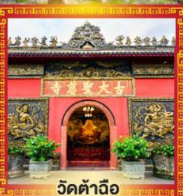
วัดต้าฉือ