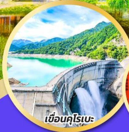
เชื้อนคุโรเบะ