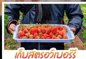
เก็บสตรอว์เบอร์รี่