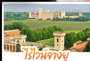
ไรไวน์จางยู