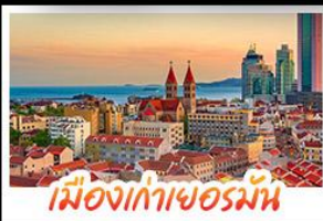
เมืองท่าเยอรมัน

เมืองท่าชิงเต่า - สลับกับเมืองโบราณหมิงสุ่ย เมืองท่าเยอรมัน - ไรไวน์จางยู - สวนสตรอว์เบอร์รี่