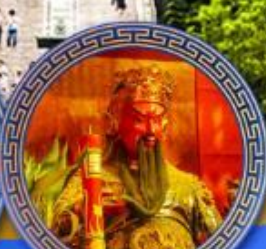
วัดกวนโถ