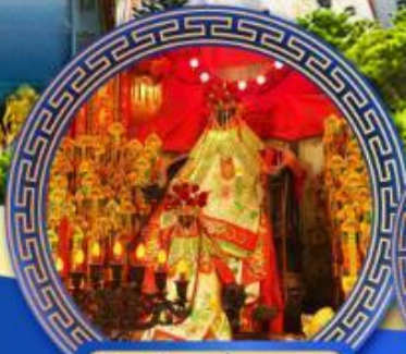
วัดเจ้าแม่กวนอิม ฮ่องกง