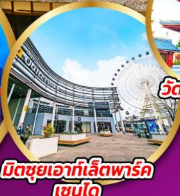
มิตซูเอากะที่เล็ดพาร์ค เซนได