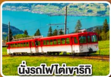
นั่งรถไฟใต้เขาโรทิก