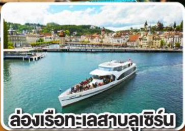
ล่องเรือทะเลสาบลูซิิร์น