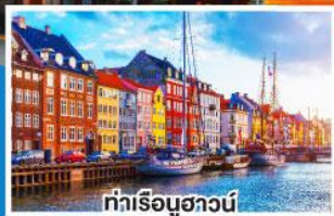
ท่าเรือฮาวน์