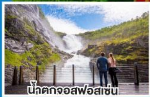
น้ำตกจอสฟอสเซิน