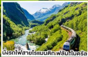
นั่งรถไฟสายโรแมนติกฟิลัมโบคริส