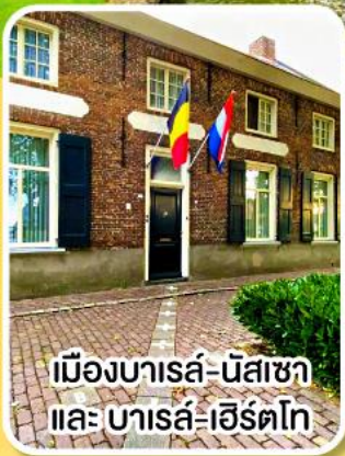
เมืองบารส์-นัสซา และ บารส์-เฮิร์ตโก