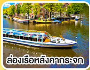
ล่องเรือหลังคากระจก

พิเศษ!! เมนูหอยแมลงภู่อบไวน์ขาว ล่องเรือหมู่บ้านไรถนน ที่รูร์น