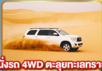
นั่งรถ 4WD ตะลุยทะเลทราย