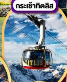
กระเช้าทิตลิส