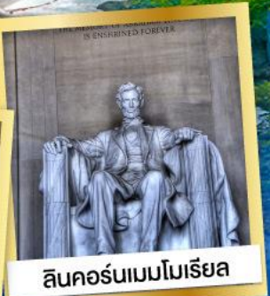
ลินคอล์นแมนโมเรียล