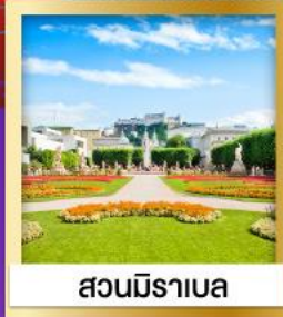
สวนมิราเบล