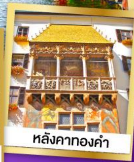
หลังคาทองคำ