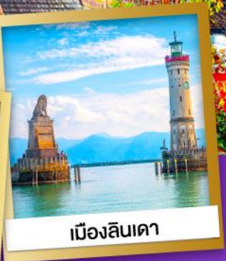
เมืองลินเดา