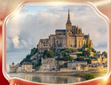
มหาวิหารมงต์แซงต์มิเชล