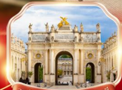
จตุรัสสถานีลา เมืองนองซี