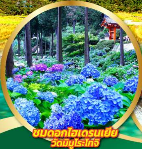
ชมดอกไม้ไฮเดรนเยีย วัดมิมุโระโทจิ