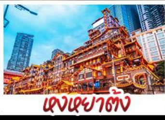
แสงเขย่าตึก