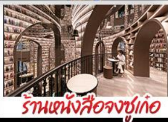
ร้านหนังสือจขูเก้อ