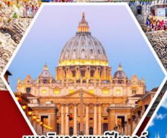
มหาวิหารเซนต์ปีเตอร์