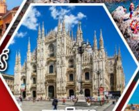
มหาวิหาร ดูโอโมแห่งมิลาน