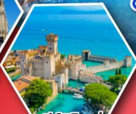
ซิร์มิโอเน่