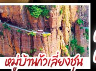
หมู่บ้านกัวเสียงชุน