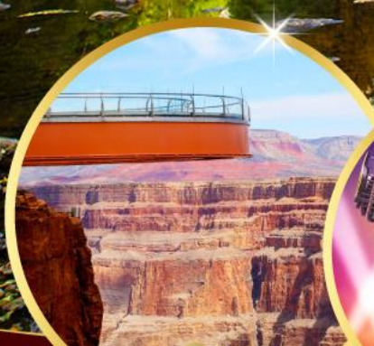
แกรนด์แคนยอน Sky walk