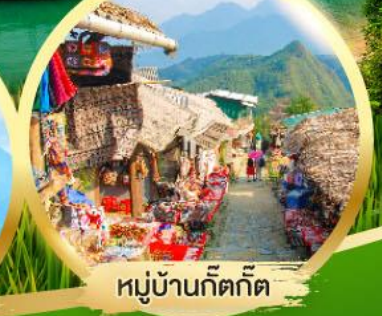
หมู่บ้านก๊ตก๊ต