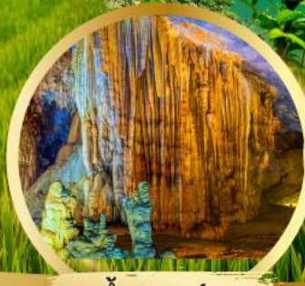
ถ้ำสวรรค์