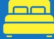
ห้องพักดับเบิล DOUBLE