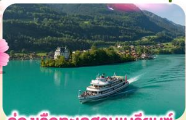
ล่องเรือทะเลสาบเบรียนซ์

พิชียอดเขาชุเนกกา 1 ในเขาที่สวยงามที่สุดเมืองเซอร์แมท