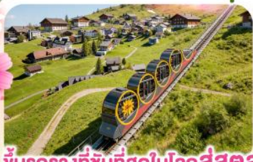
ชั้นรางที่ชันที่สุดในโลกสุดสุด

พีชียอดเขาชุนเนกกา 1 ในเขาที่สวยงามที่สุดเมืองเซอร์แมท