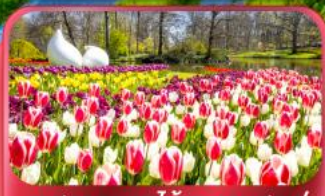
เทศกาลดอกไม้เคอเคนฮอฟ